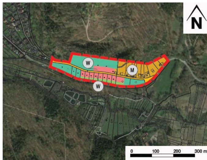
Geltungsbereich M 1:5.000 im Original

Ziel der Flächennutzungsplanänderung: Aufgrund des in der Vergangenheit durchgeführten Gebietsaustausches sind Teile des Planungsgebietes nicht in dem aktuellen Flächennutzungsplan dargestellt. Nach Rücksprache mit der oberen Verwaltungsbehörde (Regierungspräsidium Kassel) wird dringend empfohlen für den Planungsbereich ein Flächennutzungsplanänderungsverfahren durchzuführen und die Flächen in den Flächennutzungsplan mit aufzunehmen und darzustellen. Durch die spätere Genehmigung erhält die Gemeinde Nieste Rechtssicherheit.